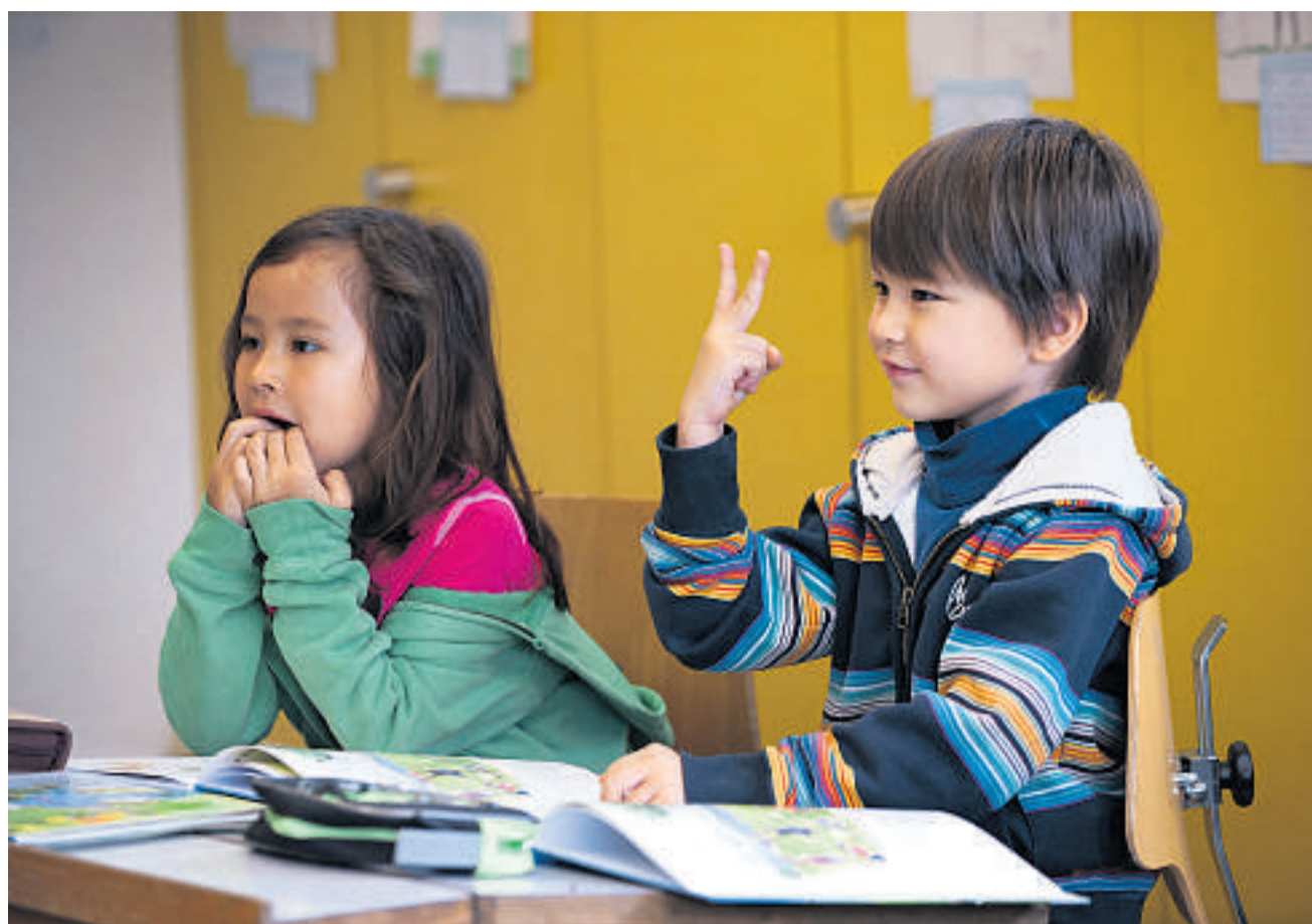
Rauchende Köpfe und lässige Gesten im Chinesischunterricht in Kriens.